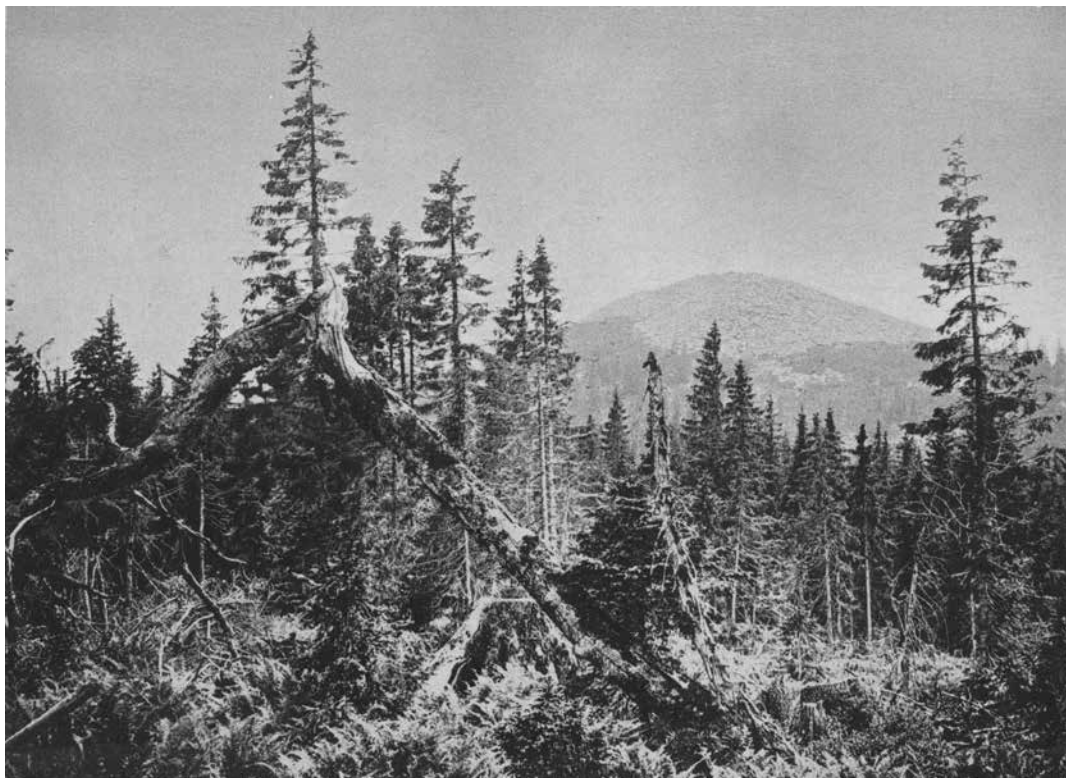
Lusengipfel um 1880