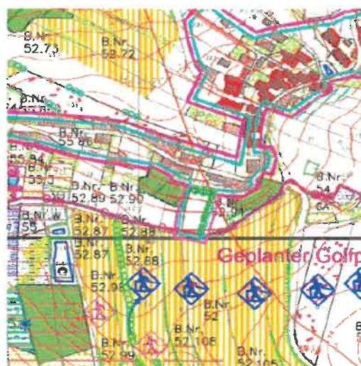
Auszug aus dem Landschaftsplan