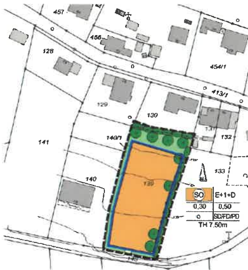
Auszug aus dem Bebauungsplan

Der Gemeinderat der Gemeinde St. Oswald-Riedlhütte hat in seiner Sitzung vom 25.10.2018 die Aufstellung des Bebauungs- und Grünordnungsplanes „Lodges am Nationalpark“ und die Änderung des Flächennutzungsplanes mit Deckblatt Nr. 6 beschlossen. Des Weiteren hat der Gemeinderat in seiner Sitzung vom 22.05.2025 noch die notwendige Änderung des Landschaftsplanes mit Deckblatt Nr. 1 beschlossen.