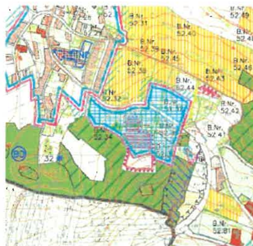
Auszug aus dem Landschaftsplan